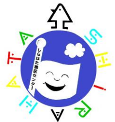
白幡地区センター シンボルマーク