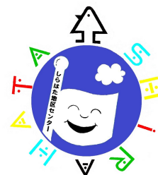
白幡地区センター シンボルマーク