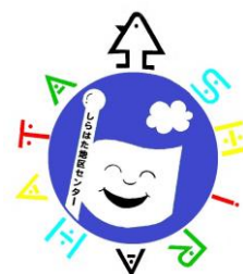
白幡地区センター シンボルマーク